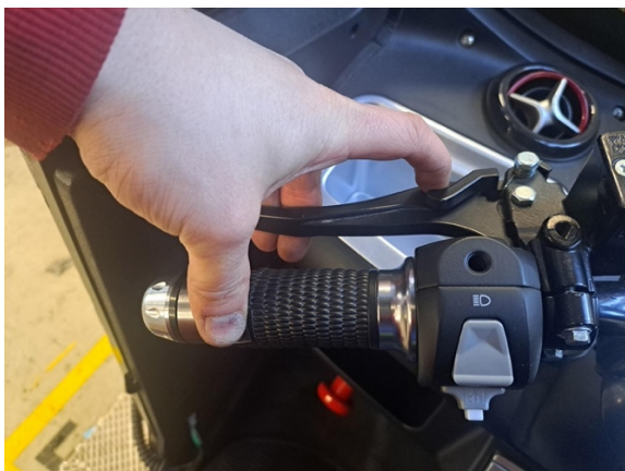
Laita seisontajarru päälle.