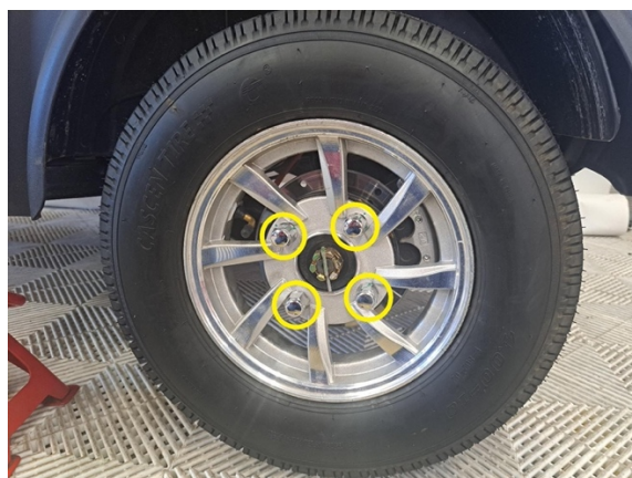
Irrota takapyörän kiinnitysmutterit. (hylsy 19 mm).