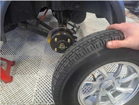
Ota takapyörä pois.