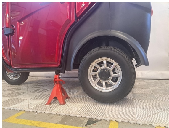
Nosta Autokruiserin vaihdettavan osan puoleinen takaosa ylös. (tunkki).