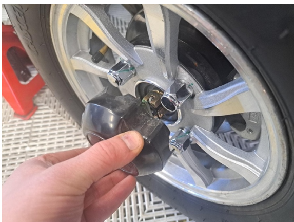
Irrota takavanteen keskikuppi.